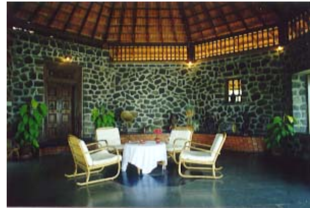
Sidhartha Suite Innenansicht